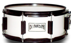
Caixa 14"x 06"