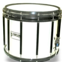
Caixa SUPER HIGH