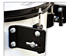
Engate reforçado do carrier