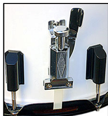
Automático da esteira em metal